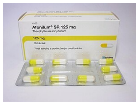
Theofylin k perorálnímu použití