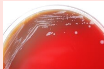
Kolonie Burkholderia mallei na krevním agaru