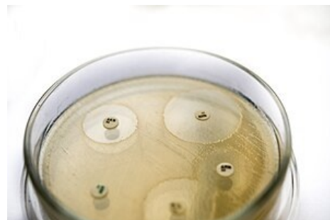
DDT – inhibiční zóny