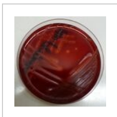
Streptococcus pyogenes na krevním agaru