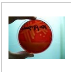
Streptococcus pyogenes, detail \beta -hemolýzy