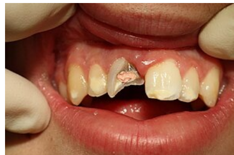
Částečně ošetřená zlomenina korunky horního řezáku.