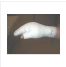
obr. 7 Správně modelovaný obvaz popálené ruky, palec je separován od ostatních prstů.