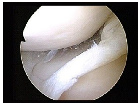
Ruptura mediálního menisku