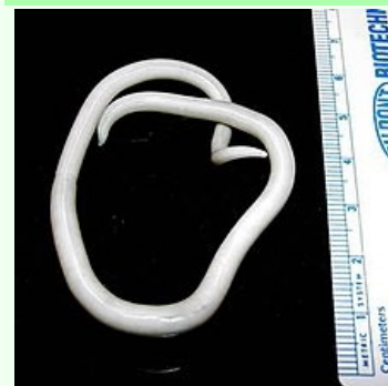
Samička hlístice druhu Ascaris lumbricoides