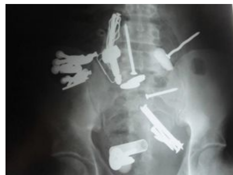
RTG snímek GIT

Při sebepoškozování vězňů dochází k bodnému poranění trávicího traktu spolýkáním ostrých předmětů (např. drátů, špendlíků).