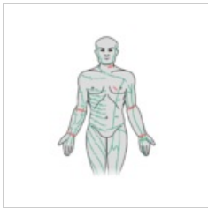
Schéma nejčastějších bodných ran na těle