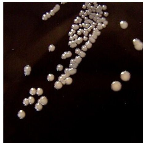
Bordetella pertussis – agar po 7 dnech kultivace