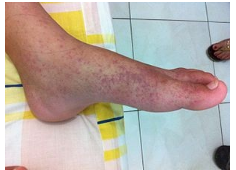
2012-01-09 Chikungunya na levé noze (Filipíny)