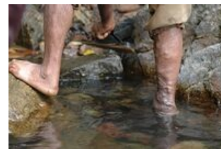
Varixy na pravé dolní končetině