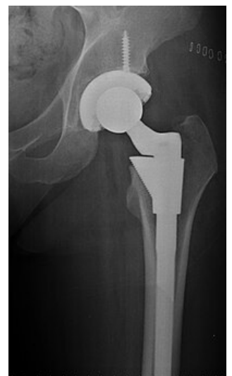
Totální endoprotéza kyčle

Artrodéza – Ztuhnutí kloubu v postavení 15° flexe a 0-5° abdukce a neutrální rotace. Pacientovi vrací možnost těžké fyzické práce vstoje, umožní plnou zátěž, ale zhoršuje životní komfort při sezení.