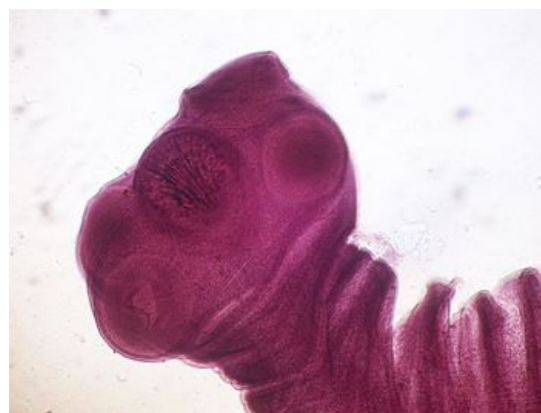
Taenia solium scolex