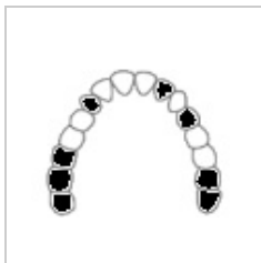
Třída II – oboustranně s mezerami