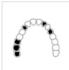
Třída II – jednostranně s mezerami