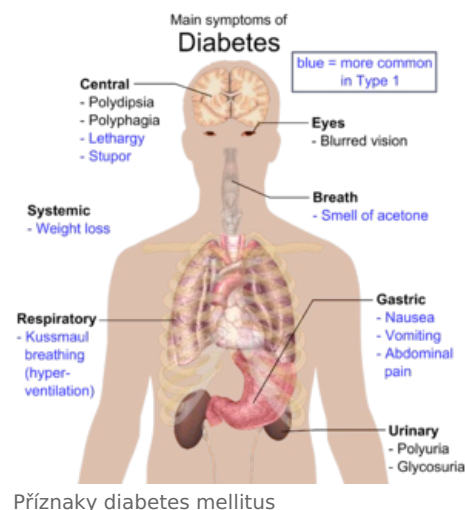
Příznaky diabetes mellitus