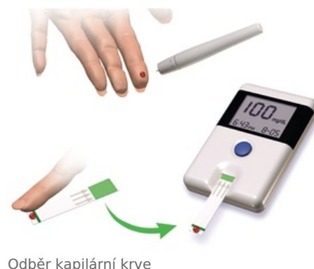
Odběr kapilární krve

U všech těhotných žen s výjimkou těch, které se již s diabetem léčí, je prováděn dvoufázový screening GDM, zajišťovaný ambulantním gynekologem. V prvním trimestru těhotenství (do 14. týdne) se stanovuje venózní glykémie nalačno . Pokud má těhotná žena glykémii nalačno opakovaně (tzn. 2 dny za sebou) \geq 5,1 \text{ mmol} \cdot \text{l}^{-1} , je u ní diagnostikován GDM, nemusí již dále podstupovat oGTT a je odeslána k diabetologovi. Všechny ženy s negativním výsledkem v 1. trimestru pak mezi 23. + 1 až 27. + 6 týdnem těhotenství podstupují tříbodový orální glukózový toleranční test (oGTT) se zátěží 75 g glukózy, pokud mají lačnou glykémii nižší než 5,1 \text{ mmol} \cdot \text{l}^{-1} . Normální glykémie při oGTT jsou < 10,0 \text{ mmol} \cdot \text{l}^{-1} v 60. minutě a < 8,5 \text{ mmol} \cdot \text{l}^{-1} ve 120. minutě. Při vyšších hodnotách je diagnostikován GDM a žena odeslána na diabetologii. Ke kompenzaci glykemií se používá podle závažnosti GDM dieta, metformin či inzulin. [2]