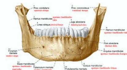
Mandibula- pohled zepředu