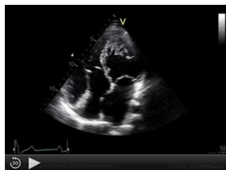
K diagnostice se využívá echokardiografie