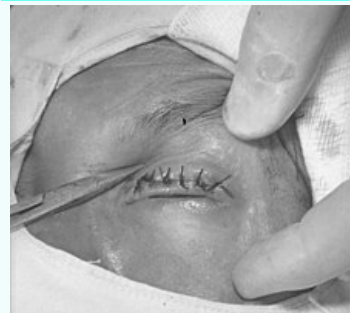
Entropium a trichiazie způsobené trachomem.

Klinický obraz postavení okrajů očního víčka, při které okraj víčka s řasami směřuje proti povrchu bulbu