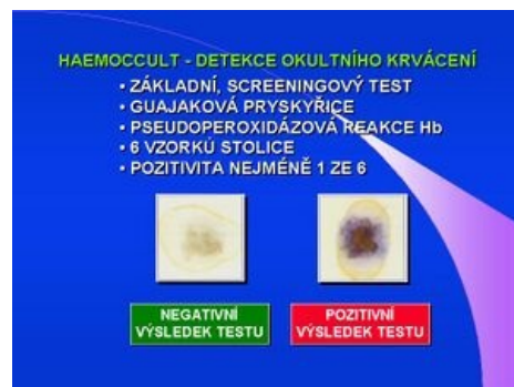
Detekce okultního krvácení

Pro screening je dodávána souprava, která obsahuje 3 testy se dvěma okénky a plastové nebo dřevěné špátle na odběr stolice. Pacient odebere vždy dva různé vzorky ze tří po sobě následujících stolicí, které rozetře na označená místa testu, testovací okénka uzavře a testy odešle do laboratoře. Laboratorní zpracování spočívá v aplikaci detekčního reagensu na opačnou stranu okének a zhodnocení případné barevné změny. Hodnocení je kvalitativní, jako pozitivní je hodnocen každý test, kde dochází ke specifickému modro-zelenému zabarvení. Citlivost Haemocult testu / cut-off hodnota je nastavena na cca 5 mg Hb/g stolice. Haemocult testem jsme ve studii prováděné na ÚKBLD 1. LF UK a VFN u > 95 000 asymptomatických osob pozitivitu 2,8 %, falešná pozitivita testovaná při srovnání s imunochemickými testy byla nulová.