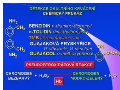
Detekce okultního krvácení – chemický průkaz

Haemocult neboli guajakový test okultního krvácení se používá pro screening kolorektálního karcinomu. Standardní testy okultního krvácení – TOKS, Haemocult test, jsou založeny na chemickém principu, pseudoperoxidázové reakci hemoglobinu. Substrátem byl původně benzidin, jako kancerogen byl modifikován na nekancerogenní dimethylbenzidin – o-tolidin (např. německý KryptoHaem), nebo tetramethylbenzidin (TMB). Dnes jsou používány testy s guajakovou pryskyřicí – z Guajacum officinale/sanctum – obsahující guajakol (o-methoxy-fenol), tedy substrát benzidinového typu. V leukoformě je bezbarvý, oxidován se zbarvuje do modrozelená. Oxidace probíhá peroxidem vodíku, katalyzátorem je hemoglobin s pseudoperoxidázovou aktivitou. Vzhledem k chemickému principu oxidační reakce může být výsledek testu ovlivněn přítomností jiných oxidačních látek (vitamin C), přítomností hemoglobinu z potravy (maso, krev), falešně pozitivní výsledek může být způsoben i přítomností rostlinných peroxidáz (některé druhy kořenové zeleniny). Doporučení (guidelines) MZ ČR pro vyhledávání a časnou diagnostiku kolorektálních nádorů – screening – jednoznačně specifikují Haemocult jako vhodný, doporučený a ověřený test. Kontrolovaný screening TOKS testem významně snižuje incidenci kolorektálního karcinomu.