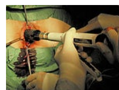
Longova metoda – použitý stapleru