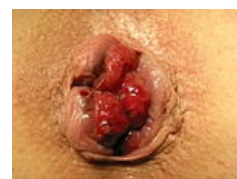
III. stupeň vnitřních hemoroidů