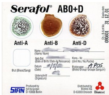
Zkouška u lůžka