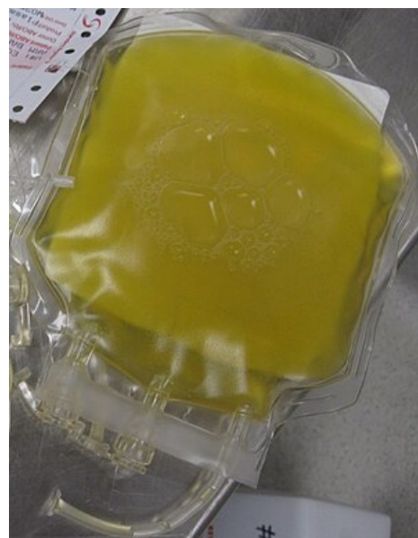
Čerstvě zmražená plazma