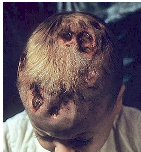
Dítě s lytickými defekty lebečních kostí u Handovy-Schüllerovy-Christianovy nemoci