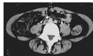
CT hluboké žilní trombózy ve v. iliaca communis

Snahou je minimalizovat riziko embolie, zabránit šíření trombózy a usnadnit rozpuštění již vytvořených trombů. Nemocného uložíme do Trendelenburgovy polohy a zahájíme antikoagulační terapii.