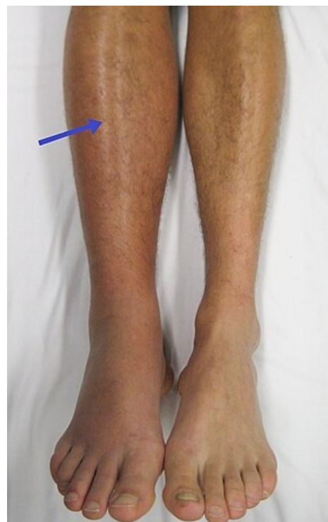
Otok pravé dolní končetiny, lividní zbarvení