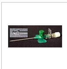
Jehla katetru s novými bezpečnostními prvky.