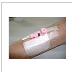
Zavedený katetr připravený k použití.