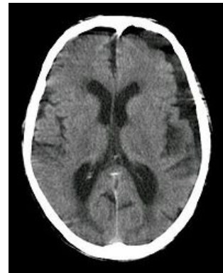
Subdurální hygrom frontálně a temporálně