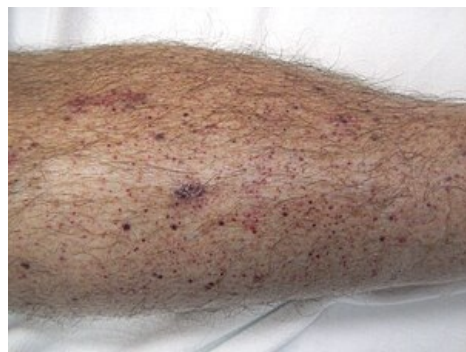
Petechie na dolní končetině (malé tečky)