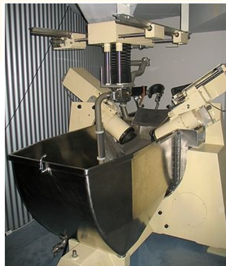
Historicky první komerčně dostupný litotryptor Dornier HM1