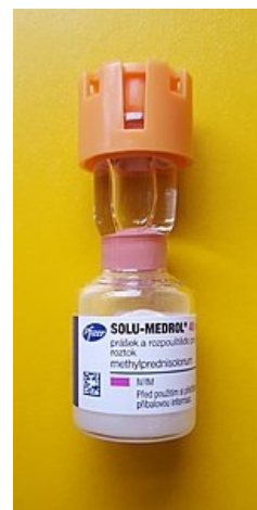
lahvička 40mg methylprednisolonu