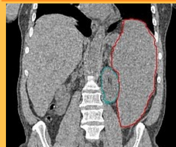
CT, zvětšení sleziny (červeně) v důsledku myelodysplastického syndromu, levá ledvina zeleně

9820/3 ( http://codes.iarc.fr/code/4502 )