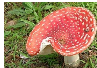
Muchomůrka hlízová, Amanita muscaria