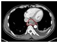
Nádor jícnu. CT obraz s kontrastem. Axiální řez.