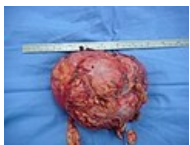
Nádor nadledviny. Makroskopický obraz 15 cm velkého karcinomu nadledviny.