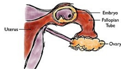
Mimoděložní těhotenství ve vejcovodu

Vysoká sliznice v děloze, můžeme vidět adnexální tumor, extrauterinní srdeční akci embrya, tekutinu v Douglasově prostoru; doppler tepen – zvýšený průtok je podezřelý.