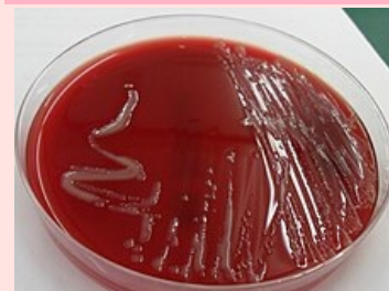
Neisseria meningitidis na krevním agaru