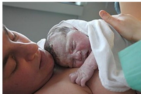
Novorozenec krátce po porodu, kůže je kryta mázkem