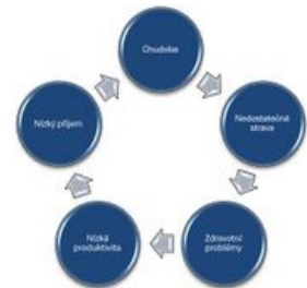
Začarovaný kruh malnutrice u dospělých

Subklinický nedostatok vitamínu D je popisovaný u značného percenta obyvateľ, ako v Severnej Amerike, tak v Európe, ale Americký Inštitút of Medicine však poukazuje na neexistenciu obecného konsenzu o adekvátnej hladine plazmatického 25OHD a tak možnosť nadhodnocení prevalence deficitu v populácii. [5]