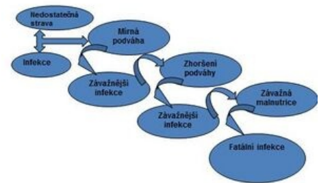
Spirála malnutrice u dětí

Mezi projevy nedostatku se řadí, xeroftalmie (suché oči), stařecké skvrny, náchylnost k infekcím dýchacích cest, akné, ekzémy, nechutenství, únava a ztráta čichu. Nemoci, které vznikají při delším nedostatku tohoto vitamínu jsou šeroslepost a záněty spojivek.