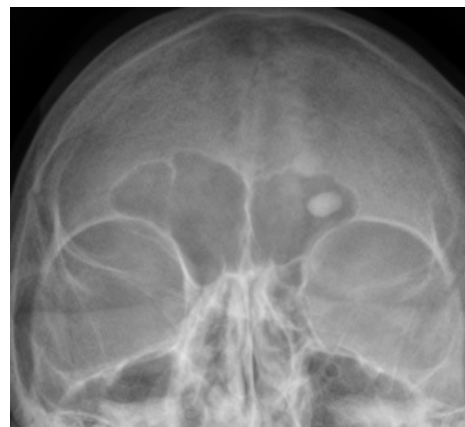
Osteom frontálního sinu