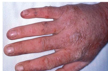
Akutní fotosensitivní reakce u EPP

Léčba: zmírnění projevů pomocí beta-karotenu, antihistaminik, melanotanu, fototerapie; prevencí je používání ochranného oblečení a speciálních krémů. Na rozdíl od akutních jaterních porfyrií EPP nezhoršují žádné léky.