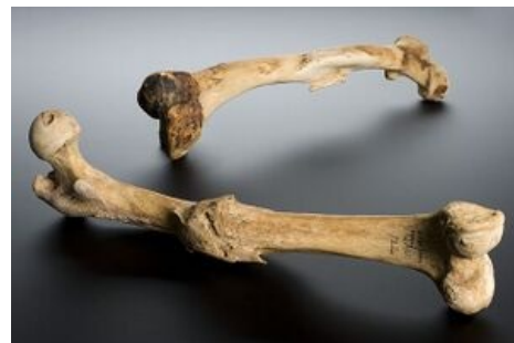
špatně zahojená zlomenina femuru

Nejzávažnější formou je pakloub infikovaný – vyskytuje se u všech výše uvedených forem a může vést až k amputaci končetiny. Zvláštním příkladem je pakloub tibie při zlomeninách bérce, kde se dříve zhojí fibula a působí jako rozpěrka (podobně při zlomeninách radia působí dřívější zhojení ulny).