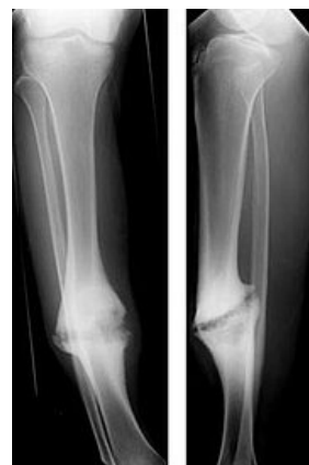
Hypertrofický pakloub tibie