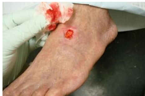
Ulcerace na dorsu nohy