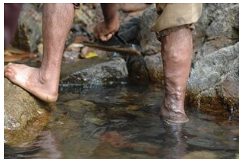
Varixy na pravé dolní končetině

Klasický výkon při poškození kmene sapheny – Babcockova operace ( stripping ). Spočívá v pečlivém vypreparování místa vtoku sapheny magny do femorální žíly ve fossa ovalis v tříslu. V tomto místě podvážeme všechny žilní přítoky (v. circumflexa ilium spf., v. epigastrica spf., vv. pudendae ext.) a kmen u vyústění protneme. Poté vypreparujeme saphenu před vnitřním kotníkem a zavedeme endostripor. Drátek protáhneme saphenou. Na konci má rozšíření na které se při protažení drátku kanálem nasouká celá saphena.