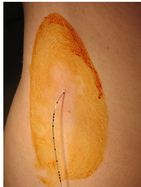
Katetr in situ – epidurální anestézie