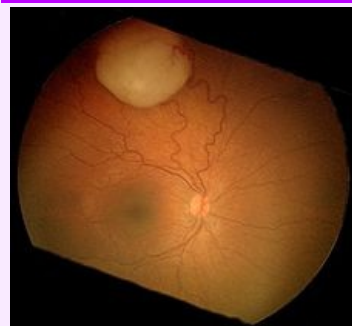
Pohled na retinoblastom vyrůstající ze sítnice