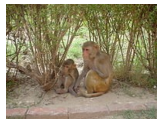
Makak rhesus ( Macaca mulatta ) – právě tento druh je spojen s objevem Rh faktoru (Rhesus faktor)