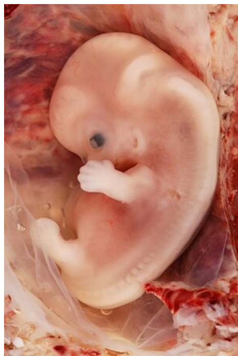
9týdenní lidský plod při mimoděložním těhotenství.