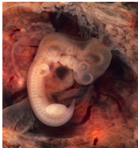
7týdenní lidské embryo při mimoděložním těhotenství.