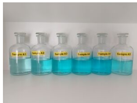
Vzorky pro druhý úkol.

V tomto úkolu proměřte spektrum vzorků A, B a C v rozmezí vlnových délek 380–1100 nm. Identifikujte jednotlivá absorpční maxima. Následně na základě počtu absorpčních maxim určete, kterou chemickou látku (viz. Chemikálie) reprezentují jednotlivé vzorky A, B a C. Do protokolu uveďte vlnové délky a odpovídající barvy ve viditelném spektru pro jednotlivá maxima. Pro další úkol určete nejlepší vlnovou délku (kdy je maximální absorpce) pro vzorek A, kterou použijete při měření kalibrační křivky a stanovení koncentrace neznámého vzorku v dalším úkolu. Vygenerovaný soubor v programu WinASPECT při tisku do pdf souboru nahrajte na na server moodle s protokolem.