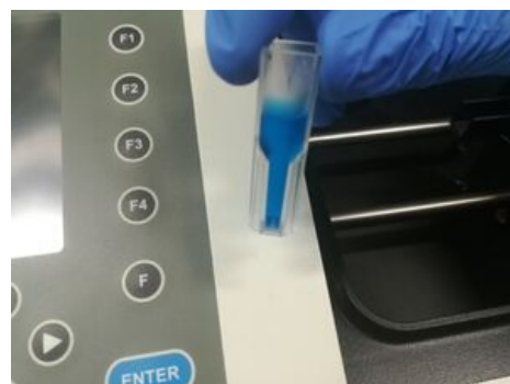
Zúžení kyvetu v její dolní části.

Podrobný návod na ovládání programu při měření koncentrace je v následujícím souboru. Návod na měření koncentrace