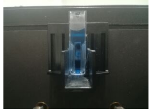
Vložená kyveta z pohledu procházejícího paprsku.