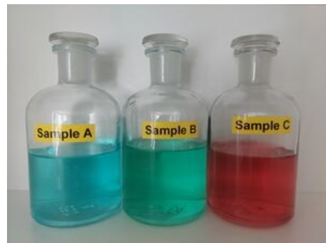
Vzorky pro první úkol.

Před vložením kyvetu jemně otřete od přebytečné kapaliny a odstraňte případné nečistoty na jejím povrchu. Otevřete prostor na vkládání vzorků. Do držáku na kyvety vložte kyvetu. Kyvetu vkládáme co nejtěsněji ke stěně držáku, tak aby světelný paprsek procházel širší částí zúženého spodku kyvety. Poté zavřete dvířka prostoru pro vzorek. Dbejte, aby kyveta stála v držáku kolmo! Spektrofotometr je přístroj citlivý na vylití kapalin. Pracujte proto opatrně. V případě vylití kapaliny opatrně vysušte polité místo!