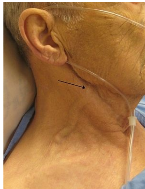
Zvýšená náplň krčních žil