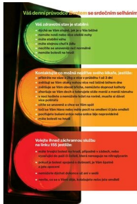
Stručné doporučení pro pacienta se srdečním selháním

U pacientů, u nichž byly vyčerpány všechny ostatní léčebné možnosti, přichází na řadu transplantace srdce .