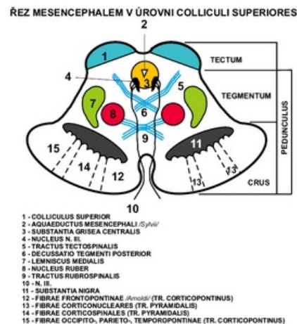
Řez středním mozkem v úrovni colliculi superiores