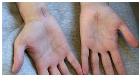
Jizvy po operaci karpálního tunelu