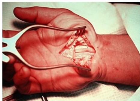
Operace karpálního tunelu