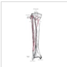
Přední strana tibie