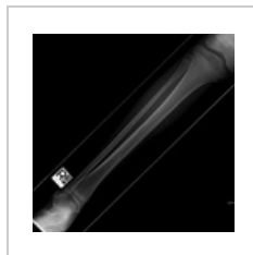
Spirální zlomenina tibie