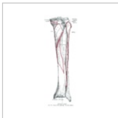
Zadní strana tibie