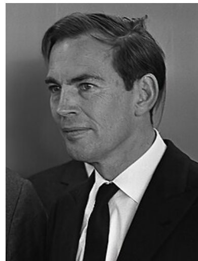
Christiaan Neethling Barnard - první člověk, který provedl transplantaci srdce